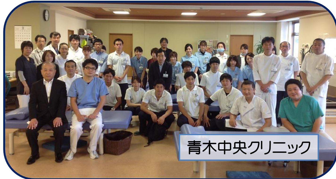
青木中央クリニック