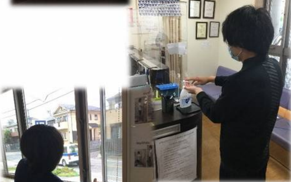
定期的に換気を行っています。