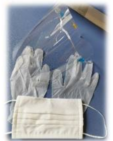
フェイスシールドやマスク、手袋を装着しております。