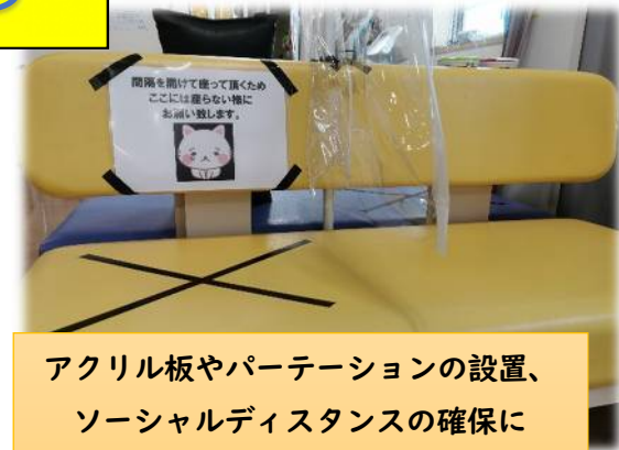
アクリル板やパーテーションの設置、ソーシャルディスタンスの確保に努めております。