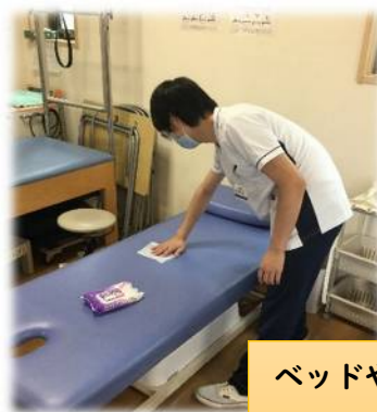
ベッドや機器、車内を定期的に除菌・消毒を行っています。